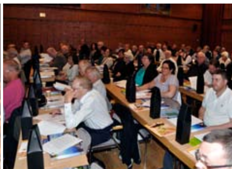
HSB Dalarnas stämma var välbesökt och blev dramatisk.