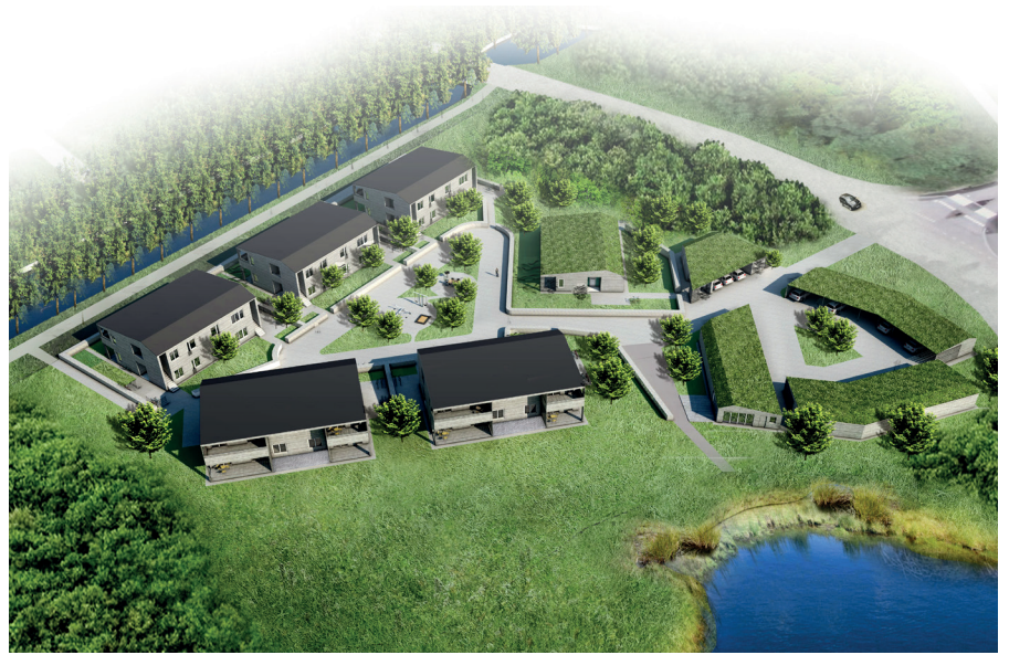
Bilderna i detta prospekt är visionsbilder. Vi reserverar oss för eventuella ändringar och tryckfel.