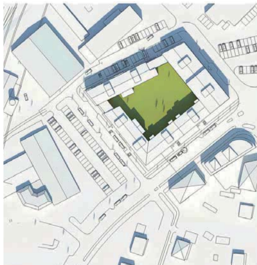
Fig 32, Sommarsolstånd kl 12.00