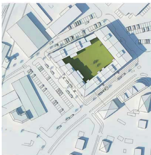
Fig 33, Sommarsolstånd kl 15.00