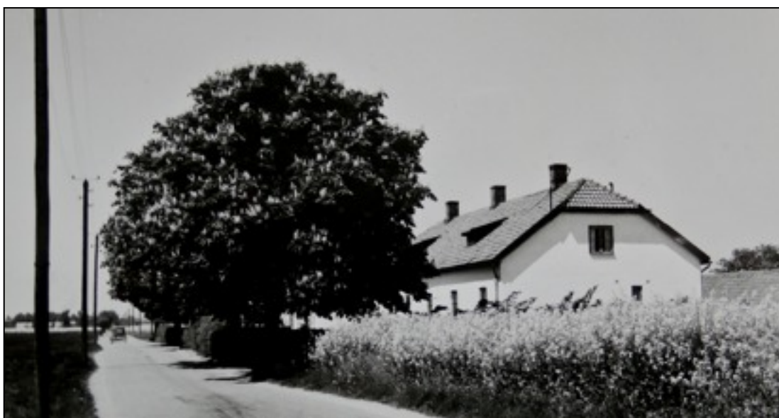
I anslutning till Rosengårds herrgård byggdes statarlängor eller stathus för gårdens statdrängar och deras familjer. (Bilden från 1963, husen revs i slutet av 1960-talet).