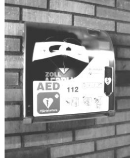
Inne i entrén

I slutet på maj anordnade styrelsen en uppskattad hjärt- och lungräddningskurs som elva medlemmar från nästan lika många portar genomförde med bravur.