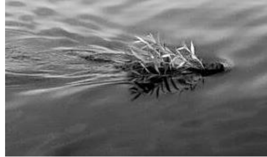
Bäver kamouflerad i en kvist

våra stränder simmar bävrar och sjöfågel runt i vattnet.