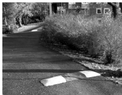
Pucklar i backen österut.

Störst är riskerna vid passagen genom 77:an till 71:an vid Sagans förskola, ner mot sänkan mot kajen och upp emot utfart, bussar och Coop.