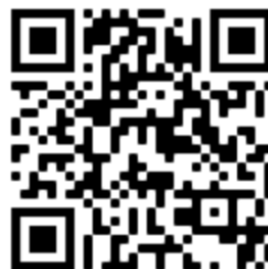
QR-kod till internetbokning

Ange brfostberga.sakerhetsintegrering.com i adressfältet i valfri webbläsare alternativt scanna QR-koden till höger för att komma direkt dit.