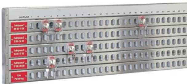
Tvätttider innan 1 mars bokas på cylindertavla

För pass innan den 1 mars gäller den vanliga cylindertavlan.