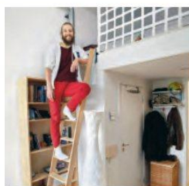
Bilder på HSB Living Lab från reportage i Hemma i HSB nummer 1 2017.