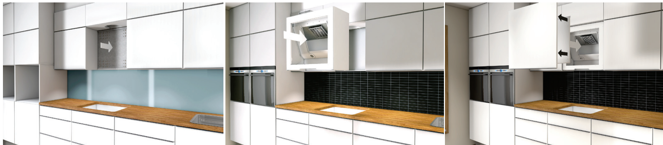
Enkel att montera. Steg 1